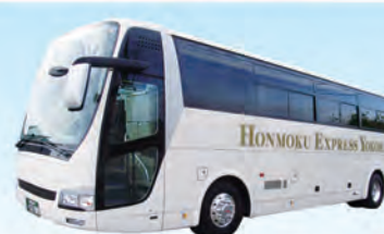
本牧バス(本牧運輸)