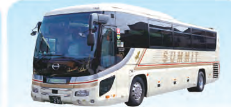
東京遊覧観光バス